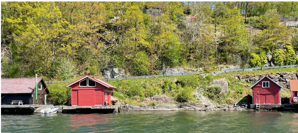
Fig. 4. Litt mindre enn halve strekningen mellom dei to raude nausta er blir føreslått regulert for to nye naust.