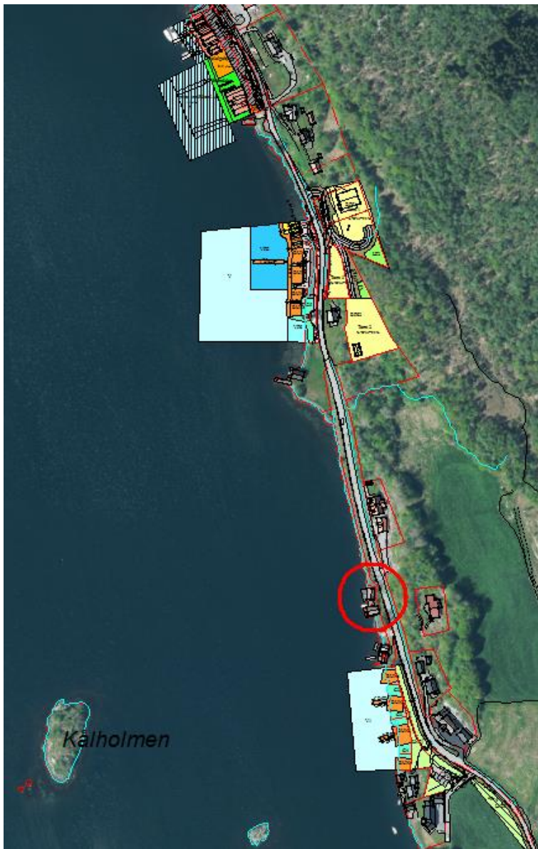
Fig. 3. Reguleringsplanar i området. Planområdet: raud ring.