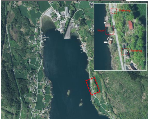
Fig. 1. Området ligg på austsida av Vatsfjorden.